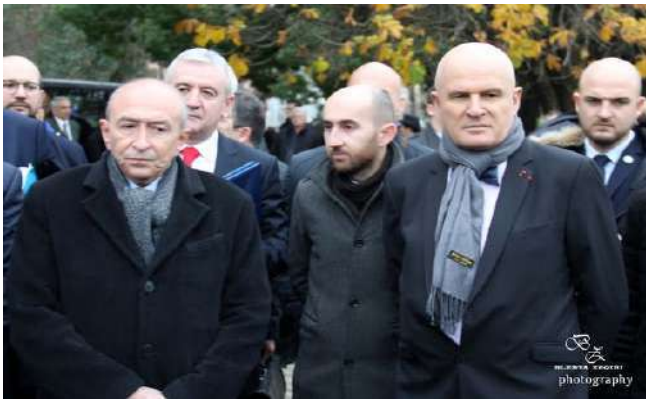
The Minister of Interior Affairs Gérard Collomb visited Albania on the 14th and 15th December 2017