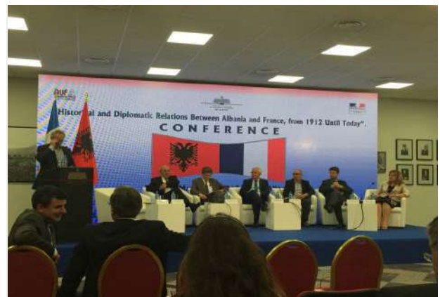
Konferenca "Marrëdhëniet historike dhe diplomatike ndërmjet Francës dhe Shqipërisë që nga 1912 deri ne ditët e sotme »