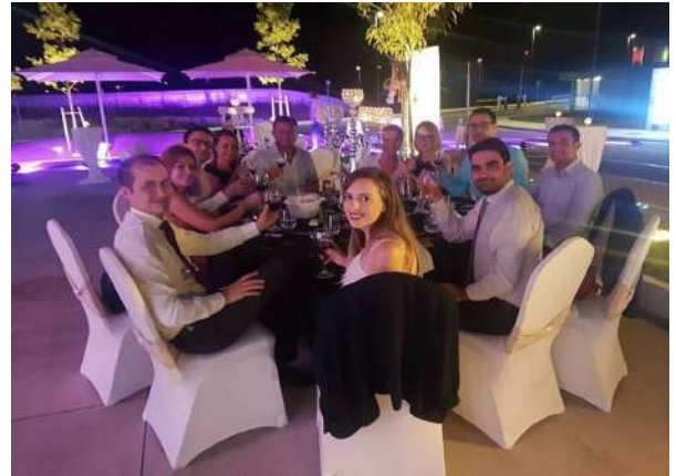
Një darkë mahnitëse e organizuar nga anëtari ynë Hotel Dilomat