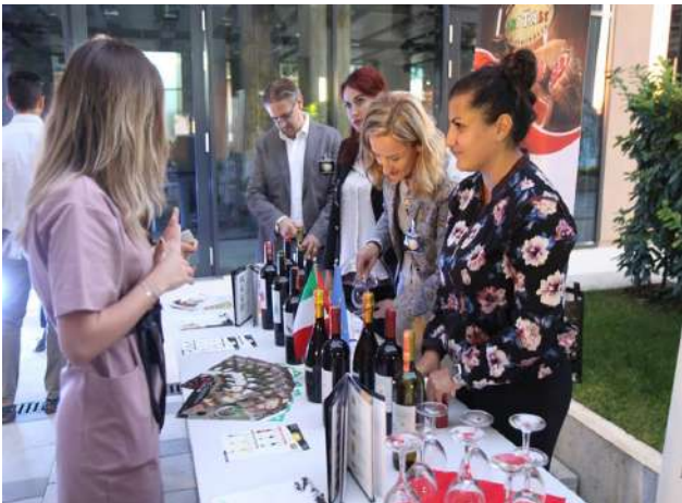
"International Tasting Wine & Spirits", Tetor 2017 (150 pjesëmarrës)