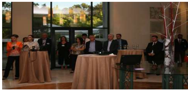
11 Maj 2017 « Business Club Cocktail with SHPF and CCIFA » (100 pjesëmarrës)