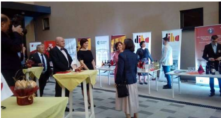
"International Tasting Wine & Spirits"