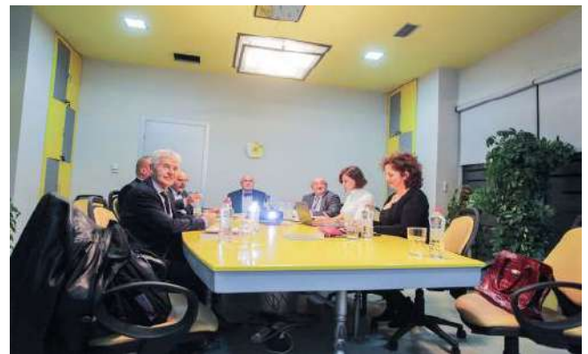
Këshilli drejtues i CCI France Albanie, Çelesi Group