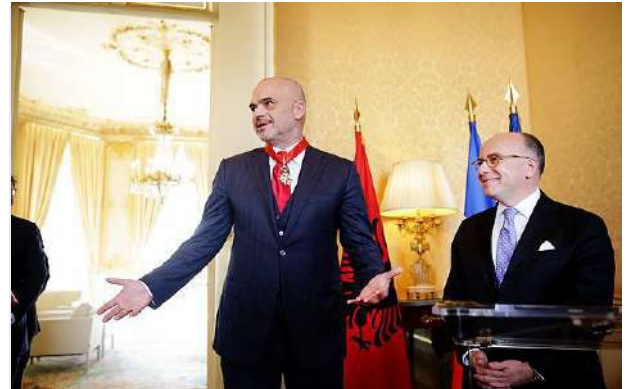
Edi Rama mori titullin « Commandeur de la Légion d'Honneur »