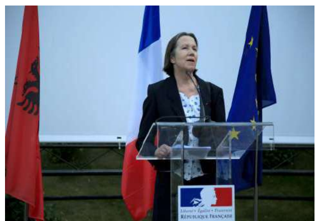
Festa kombëtare e 14 korrikut në Tiranë !