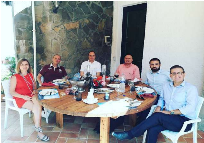
Drekë e organizuar për t'i urreuar mirëseardhjen anëtarit të ri GPS Group