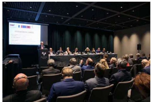
Konferencë e cila bashkoi zyrtarët gjyqësor francezë dhe shqiptarë