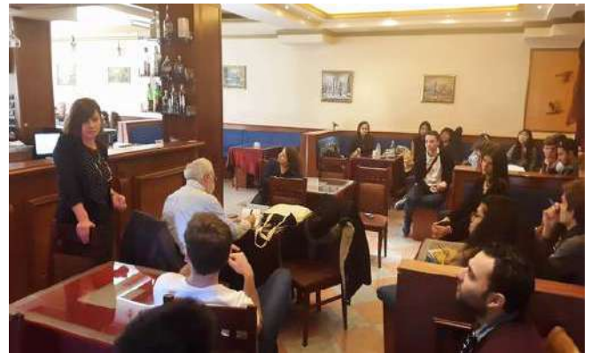
Visit of the students of the French business school "ICN Business School"