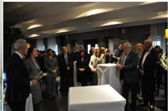
Kokteji i ofruar në fund të ceremonisë në varrezat ushtarake në Korçë