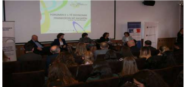
Forumi Ekonomik Frankofon, 2017 (150 pjesëmarrës)