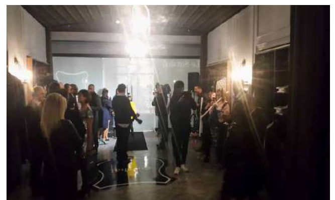
Inagurimi i "LE SUIVABLE"