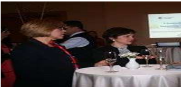
Asambleja e pestë vjetore e Dhomës u mbajt ditën e enjte, më 26 janar 2017 (60 pjesëmarrës)

Pothuajse 750 persona kanë marrë pjesë në mbrëmjet tona të network-ut