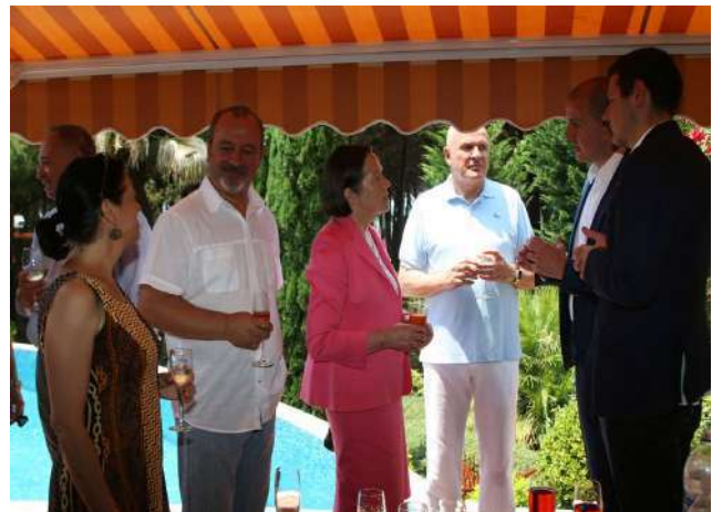
17 Qershor 2017, «Festa e Verës » (90 pjesëmarrës)