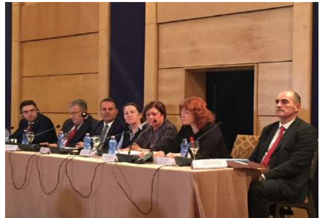
Seminar mbi luftën kundër trafikut të drogës