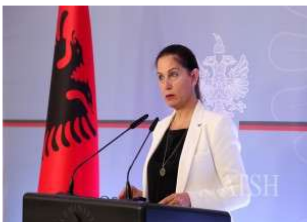
Ministrja e Kulturës Mirela Kumbaro u nderua me urdhërin francez « Oficere e Nderit në Art dhe Kulturë »