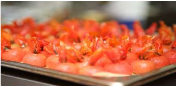
« Goût de France », më 21 mars 2017 (200 pjesëmarrës)