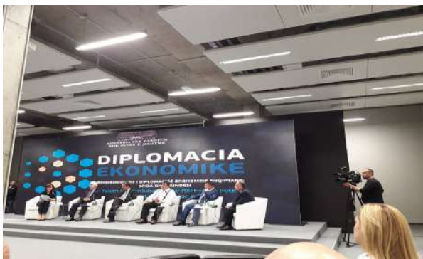
Konferencë : Diplomacia ekonomike