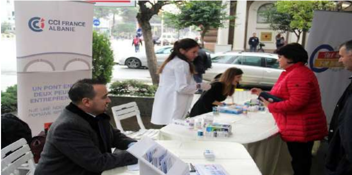
"Dita Botërore e Diabetit"