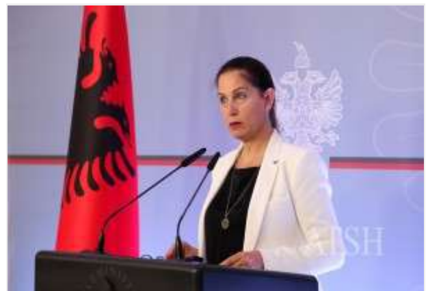
Ministria e Kulturës mori titullin « Oficere e Nderit në Art dhe Kulturë »